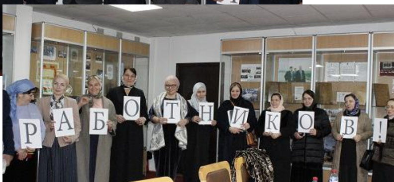
Участники заседания Чеченской Республиканской трехсторонней комиссии по регулированию социально-трудовых отношений